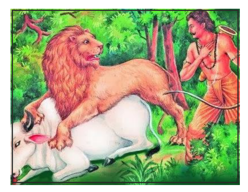
अलं महीपाल! तव श्रमेण , प्रयुक्तमप्यस्तिमितोवृथा स्यात् । न पादपोन्मूलन शक्ति रहः शिलोच्चये मूर्च्छति मारुतस्य।।

सहसा शरण्य: स मृगेन्द्रगामी मृगेन्द्रवधाय निषङ्गाच्छरमुद्धर्तुमैच्छत्। तस्य दक्षिणकरसायकपुङ्खेसक्ताङ्गुलि: अभवत्। विबृद्धमन्यु: स धनुर्धर: पुर:स्थितमप्यागस्कृतं न किंचिदपि कुर्वाणो स्वतेजोभिरन्त: अतप्यत्। तं सिंहोरूसत्वं विस्मितं विस्मापयन् सिंह: मनुष्यवाचा एवमुक्तवान् –