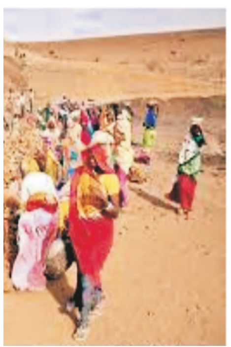
मनरेगा में महिलाओं के लिए रोजगार