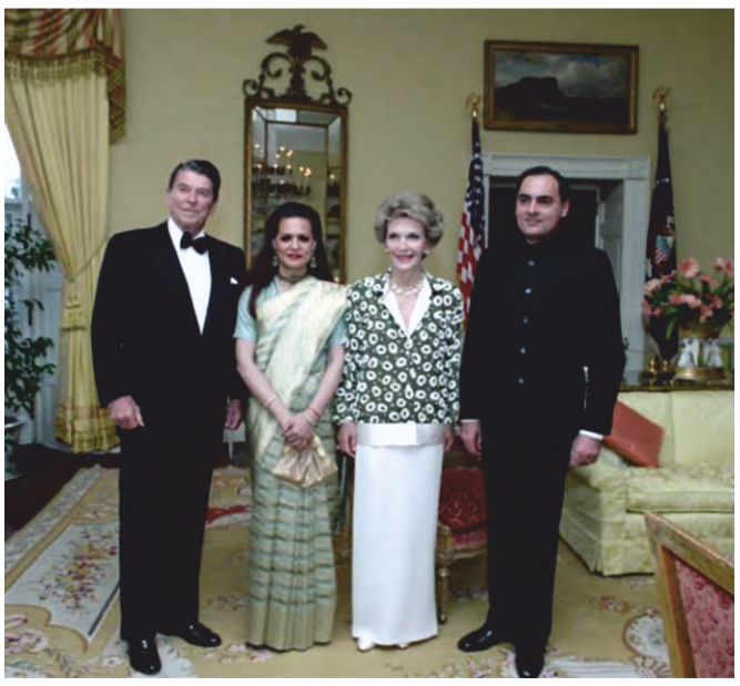
राजीव गाँधी और अमेरिकी राष्ट्रपति रीगन

सन 1984—89 तक राजीव गाँधी के काल में विदेश नीति के चार मुख्य तत्वों-निःशस्त्रीकरण, उपनिवेशवाद–उन्मूलन, विकास तथा शांति की कूटनीति पर सर्वाधिक जोर दिया गया। 1988 ई. में राजीव गाँधी ने संयुक्त राष्ट्र संघ की महासभा में 'आण्विक हथियार मुक्त और अहिंसक विश्व व्यवस्था' की योजना प्रस्तुत की जिसकी सारे विश्व में प्रशंसा हुई | क्षेत्रीय सहयोग के उद्देश्य से 'सार्क' का निर्माण किया गया, जिसमें राजीव गाँधी की महत्वपूर्ण भूमिका थी। दक्षिण एशिया के पड़ोसी देशों की विश्व राजनीति में क्षेत्रीय सहयोग की पहली शुरुआत थी 'दक्षेस' (SAARC) का गठन। दक्षिण एशियाई क्षेत्रीय सहयोग संगठन अर्थात